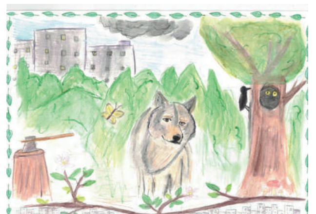
Evanna HERVÉ - 1er prix des 11-15 ans

L'essentiel, chaque enfant a contribué par sa participation à une réflexion collective sur la biodiversité et sur la nécessité de préserver le vivant sous toutes ses formes. ●